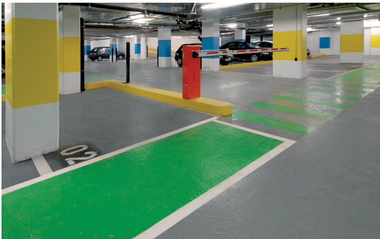
Sikafloor® MultiDur ET-20