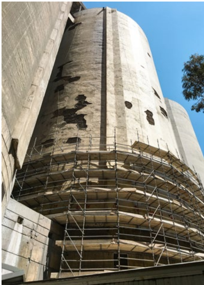
Reparação de Silos no Líbano - Antes