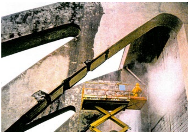
Renovação Cassell Coliseum, Virgínia, EUA - Antes