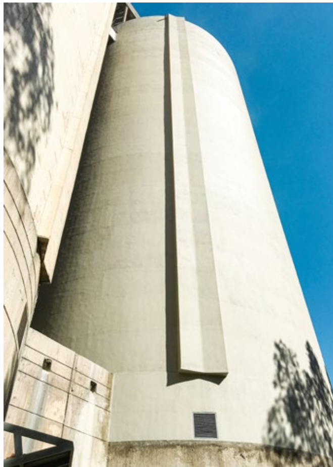
Reparação de Silos no Líbano - Depois