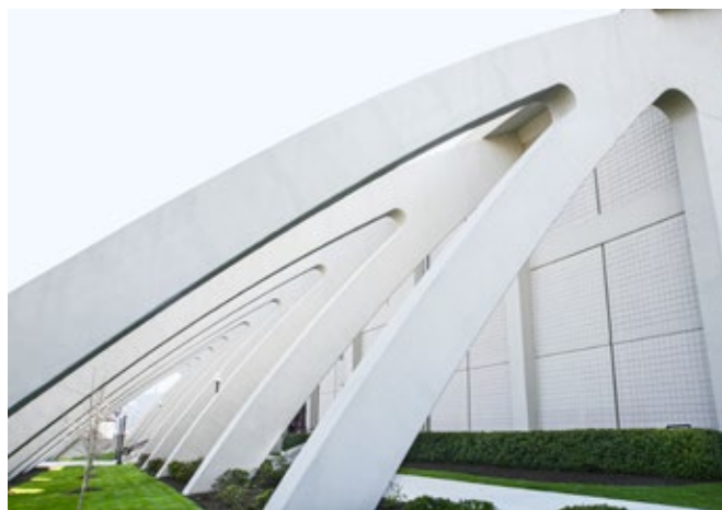
Renovação Cassell Coliseum, Virgínia, EUA - Depois